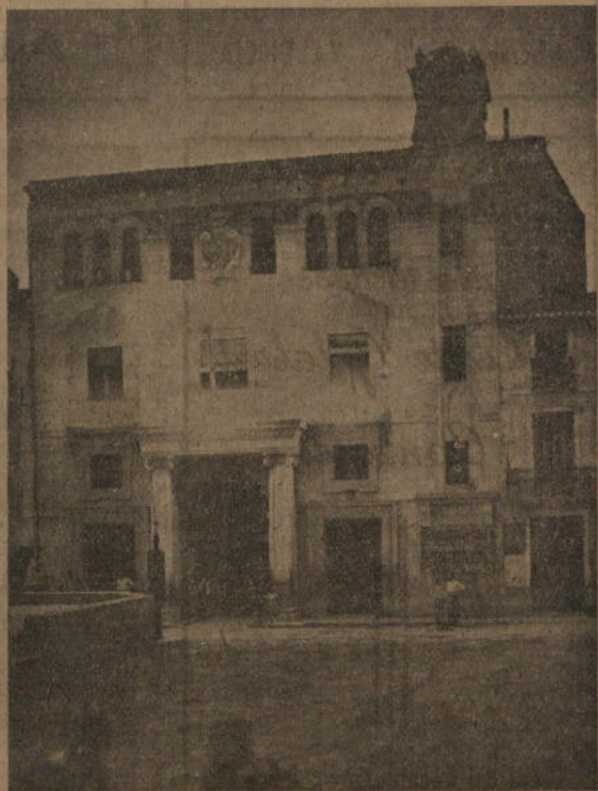
Iluminación nocturna de la Casa Ayuntamiento durante los festejos