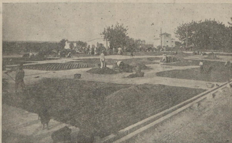
SECADERO DEL ARROZ

Por todos son sobradamente conocidas las defectuosas condiciones en que se efectuaban las labores de recolección del arroz, que coinciden con las primeras lluvias otoñales, sin que el agricultor tuviera los medios necesarios para defender su preciada cosecha. La carencia absoluta en esta Villa de secaderos apropiados, ya que utilizaban para el secado del arroz las mismas eras de arcilla que sirven para la trilla a caballería, y las malas condiciones de su al-