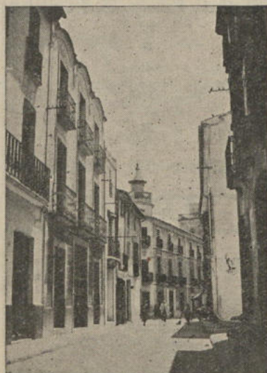
CALLE CALVO SOTELO