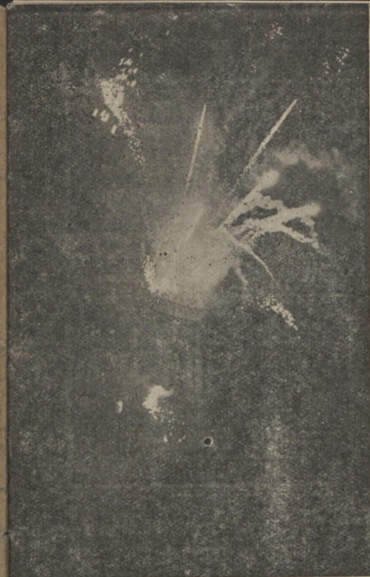
La fantástica carcasa que al vecindario entusiasma