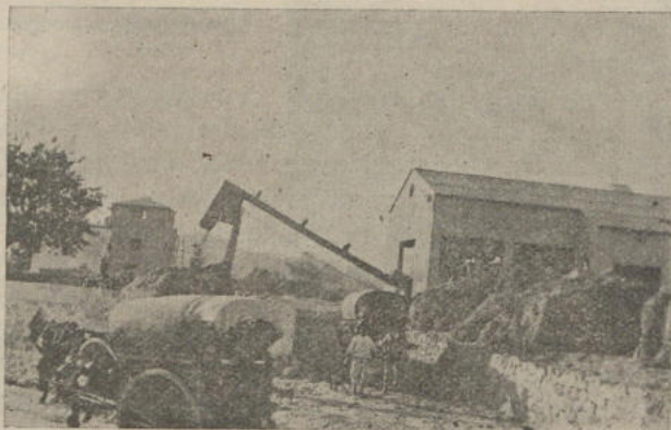
TRILLADORA SAN ISIDRO

Por todos los agricultores es conocida la inmensa labor de apoyo realizada en