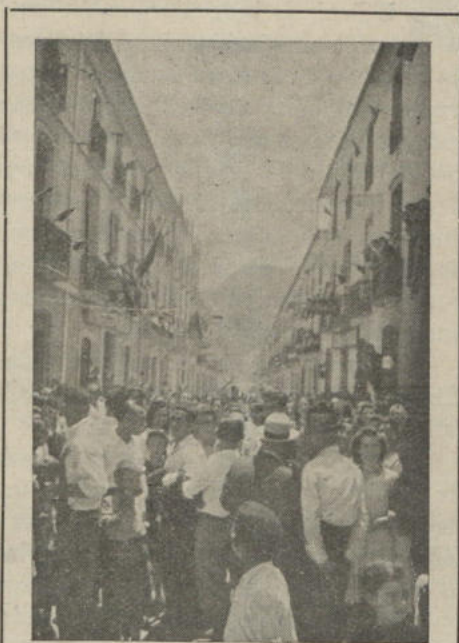
En la calle José Antonio Una traca va a estallar, Del entusiasmo ha de dar Tanta gente testimonio.

Todo lo cual, mezclado en su fondo con los más escogidos acordes musicales, hacen que las fiestas de la preciosísima Sangre del Señor, sean la cumbre de todas las fiestas pegolinas.